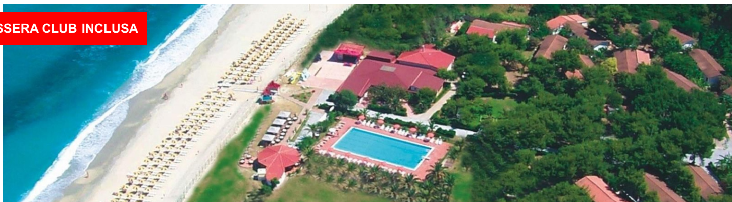
Quote per persona a settimana in camera classic in pensione completa plus e tessera club inclusa